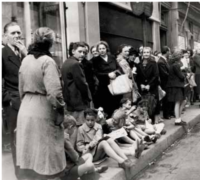
Pénurie de pain à Paris, 1946.

Intervenant devant le comité central du parti communiste le 18 mai 1945, Benoît Frachon déclare : « Depuis huit mois nous avons freiné le mouvement de masse [...] nous ne l'avons pas étouffé, mais nous l'avons canalisé. En