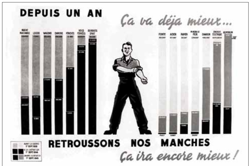
Affiche pour la bataille de la production, 1945.

Dans ce contexte, faut-il comprendre comme une promesse d'avancées nouvelles le fait qu'un décret en date du 3 janvier 1946 décide de l'établissement d'« un premier plan d'ensemble pour la modernisation et l'équipement économique de la métropole et des territoires d'outre-mer » ? Incontestablement, bien que dans des conditions difficiles et peut-être à cause d'elles, la période pousse aux innovations sociales et aux initiatives politiques. Mais cette capacité de la classe ouvrière à faire irruption dans le fonctionnement de la société, à prendre en mains son